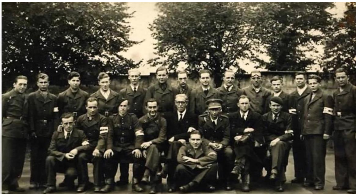
Membres du Front de l'indépendance (FI) en octobre 1944