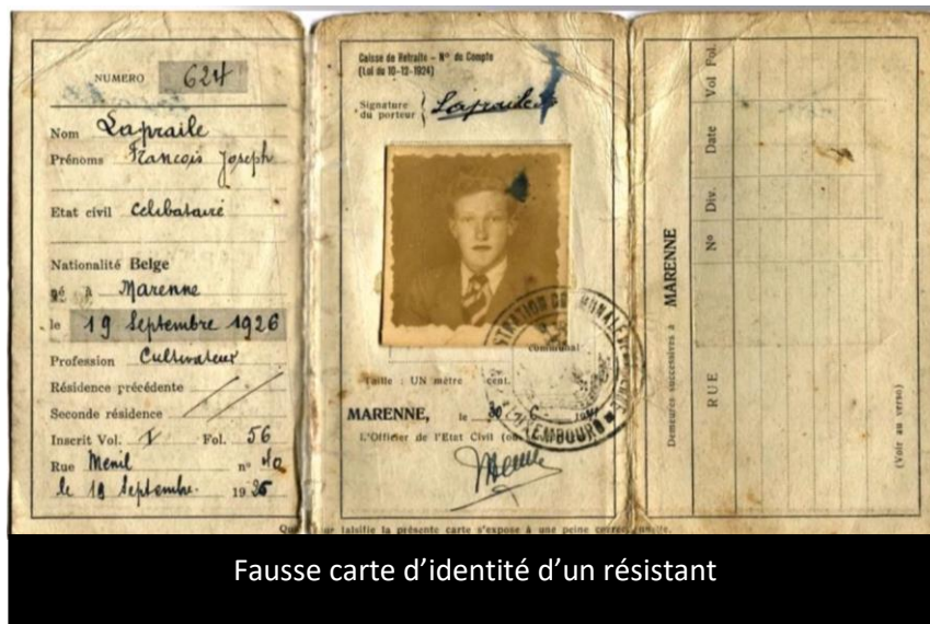
Fausse carte d'identité d'un résistant