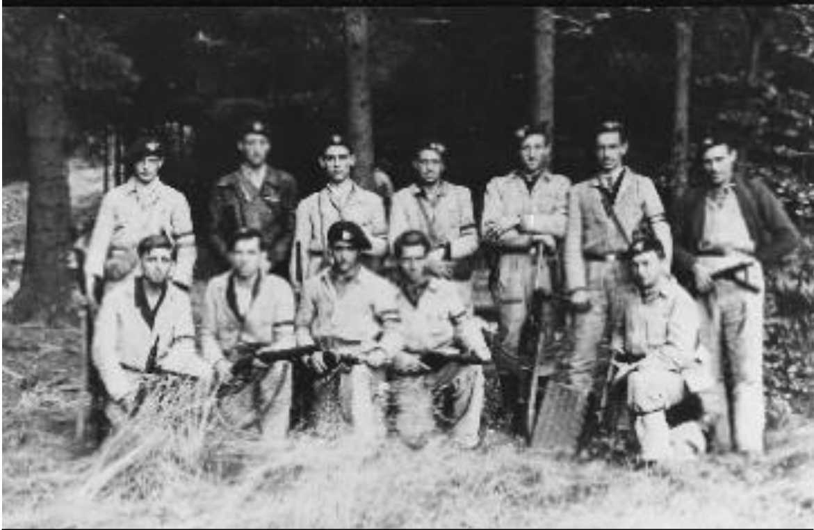
Photo d'un groupe de résistants de l'Armée Secrète de la région de Marche-en-Famenne